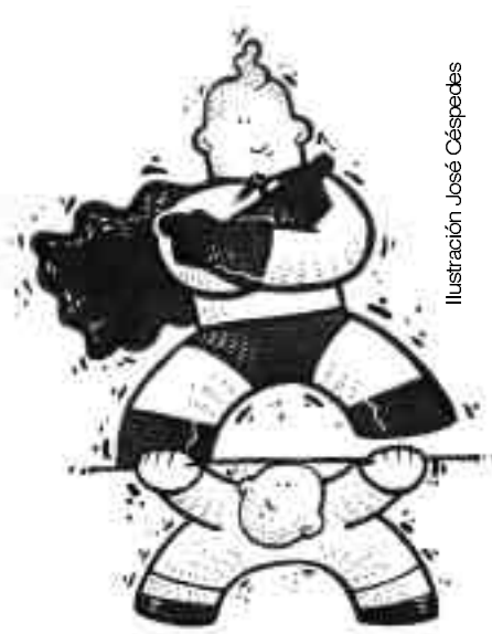
Ilustración José Céspedes

estos se negaran a la explotación de la tierra (por ejemplo) por parte de una transnacional, pero los Estados no pueden demandar a las empresas, aunque ellas estuviesen contaminando los ríos, el medio ambiente, etc.