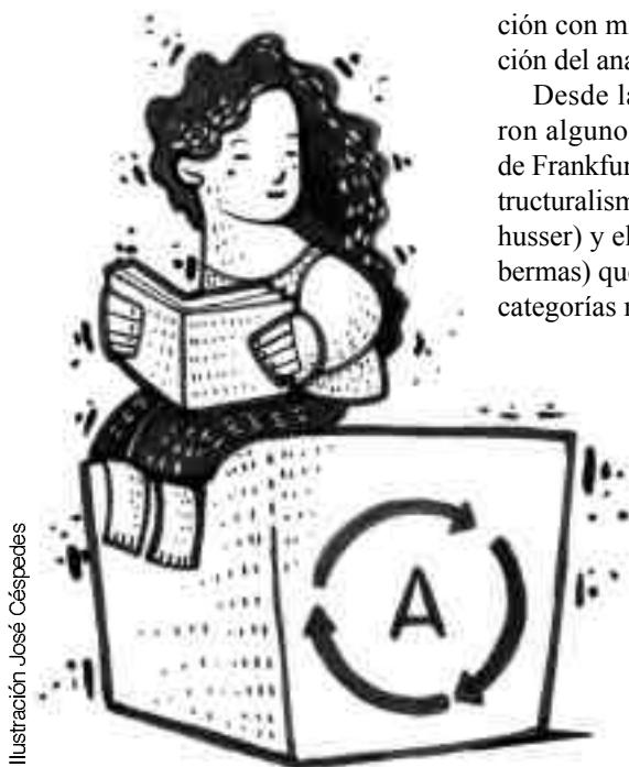
Ilustración José Céspedes

Siguiendo en esta discusión creo que el estudio de estos autores y teorías posmodernas, junto con el estudio profundo del anarquismo puede ayudarnos a crear un nuevo espectro teórico y práctico lo suficientemente coherente como para alimentar el pensamiento radical en el siglo XXI. Para esta labor debemos tratar de unir el análisis académico con la praxis activista creando canales de comunicación importantes como para poder influir en el curso de la historia de nuestro país. Hago la salvedad de que esto no debe hacerse como en el pasado, donde los intelectuales eran la dirección y conciencia del