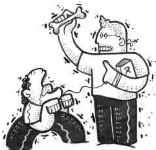
Ilustración José Caspedes

Aarón Moya Gutiérrez aaronmg27@hotmail.com