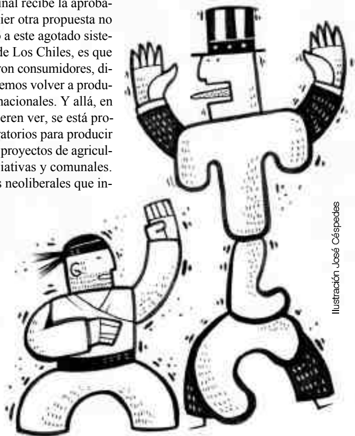
Ilustración José Céspedes

No se discute con el destino, o cedemos a sus poderes de fascinación o nos rebelamos. El reverso del destino es la conciencia, la libertad. Octavio Paz